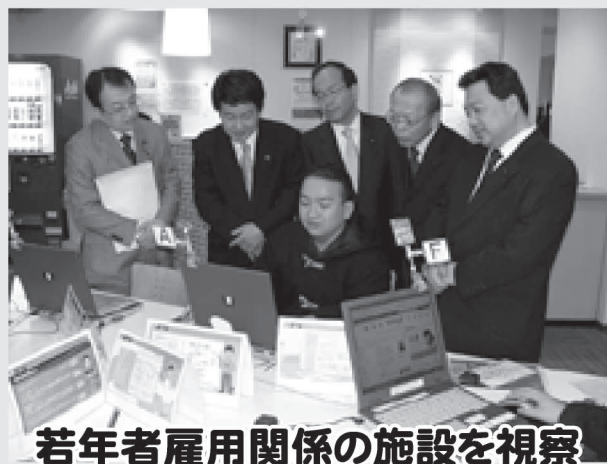
若年者雇用関係の施設を視察

全国的に若者の雇用格差が問題となっている中、1月、札幌市内の若年層の雇用関係施設を訪問、関係者と意見交換しました。